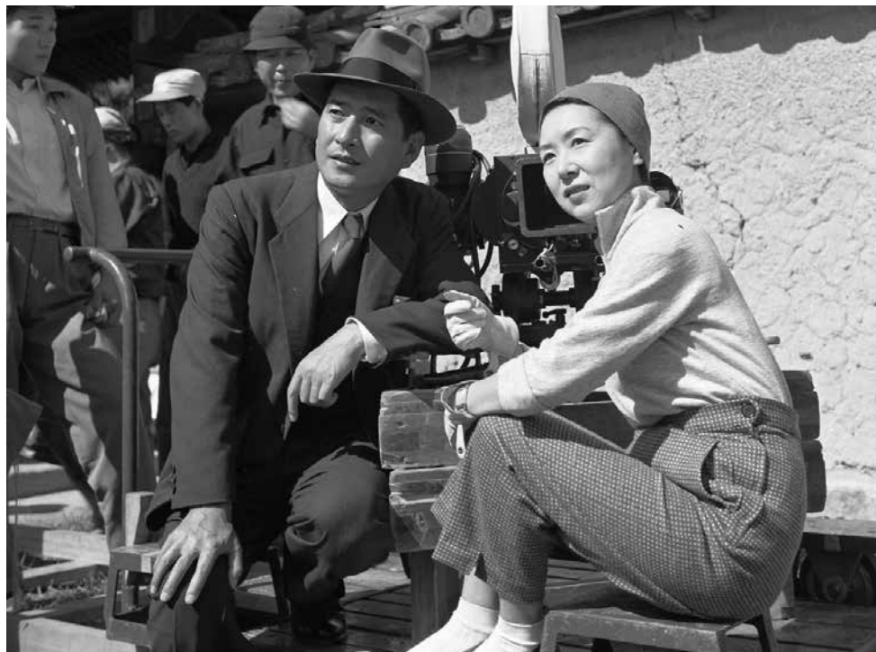
Dreharbeiten zu TSUKI IWA NOBORINU

1953, als sie mit KOIBUMI (LIEBESBRIEF) ihren ersten eigenen Film inszeniert, ist die Schauspielerin Kinuyo Tanaka auf dem Gipfelpunkt ihrer Karriere, ein Superstar, drauf und dran, nach Japan auch den Rest der Welt zu erobern – insbesondere für ihre Auftritte in den Filmen Kenji Mizoguchis wird sie auf europäischen Festivals gefeiert; gleichzeitig ist sie erst die zweite Frau überhaupt, die in Japan professionell als Regisseurin arbeitet (nach Tazuko Sakane, die 1936 einen Spielfilm und Anfang der 1940er Jahre eine Reihe dokumentarischer, beziehungsweise propagandistischer Filme hauptsächlich in der Mandschurei dreht).