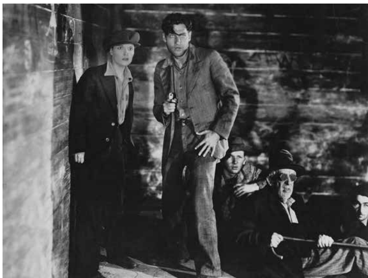
BEGGARS OF LIFE