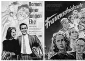
Filmmuseum München Kurt-Heinz Marquardt GDR-Einführung Berlin

Kurt Maetzig / Slatan Dudow Roman einer jungen Ehe & Frauenschicksale