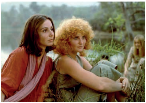
DIE EINE SINGT, DIE ANDERE NICHT