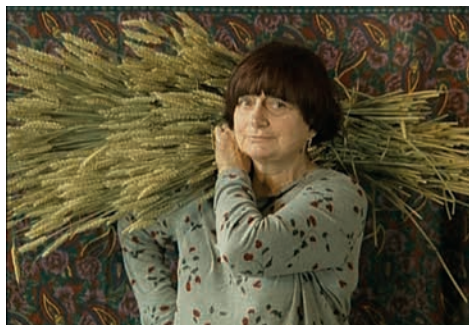
DIE SAMMLER UND DIE SAMMLERIN