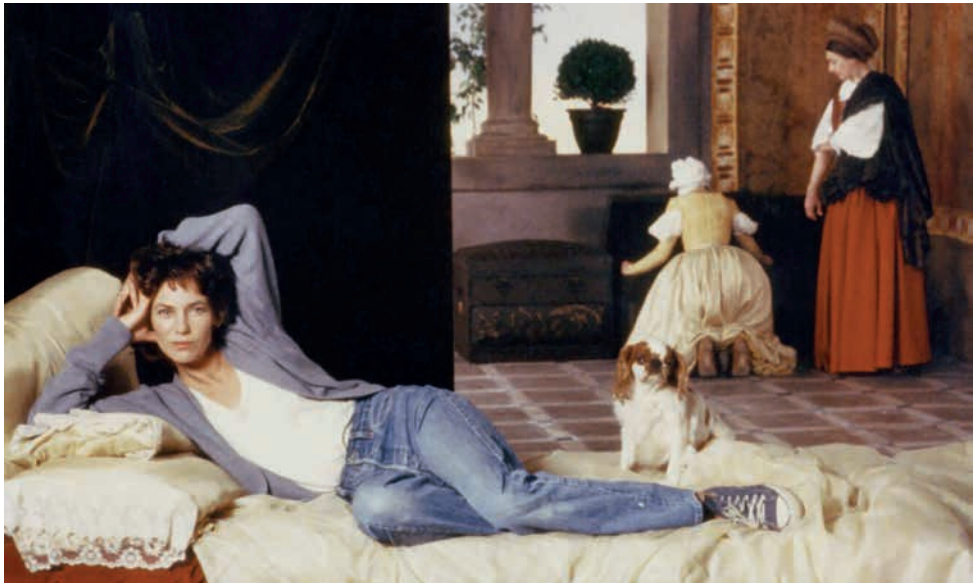
JANE B. ... WIE BIRKIN