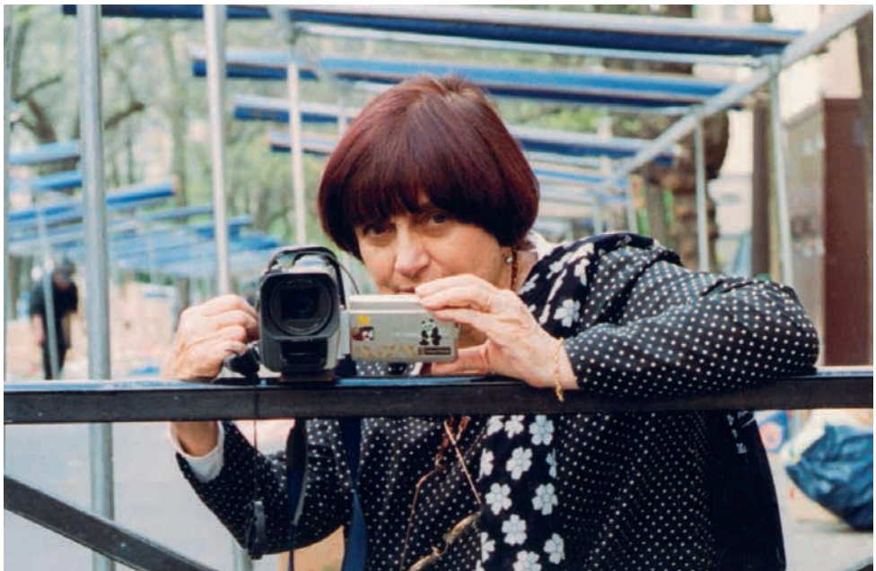
Agnès Varda in DIE SAMMLER UND DIE SAMMLERIN

zu Julien (Mathieu Demy, Vardas Sohn) dem Freund ihrer Tochter Lou (gespielt von der leiblichen Tochter Birkins, Charlotte Gainsbourg), hingezogen fühlt. Und er sich zu ihr. Den Titel des Films liefert ein Videospiele, das Julien gerne spielt. Das Skript zum Film beruht auf einer Idee Jane Birkins. Varda nimmt sie ernst und bewertet das unangemessene Verhältnis nicht. Sowohl Mathieu Demy als auch Charlotte Gainsbourg beschrieb den Dreh später aber als distanzlos.