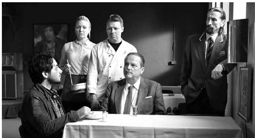
TOIVON TUOLLA PUOLEN – DIE ANDERE SEITE DER HOFFNUNG